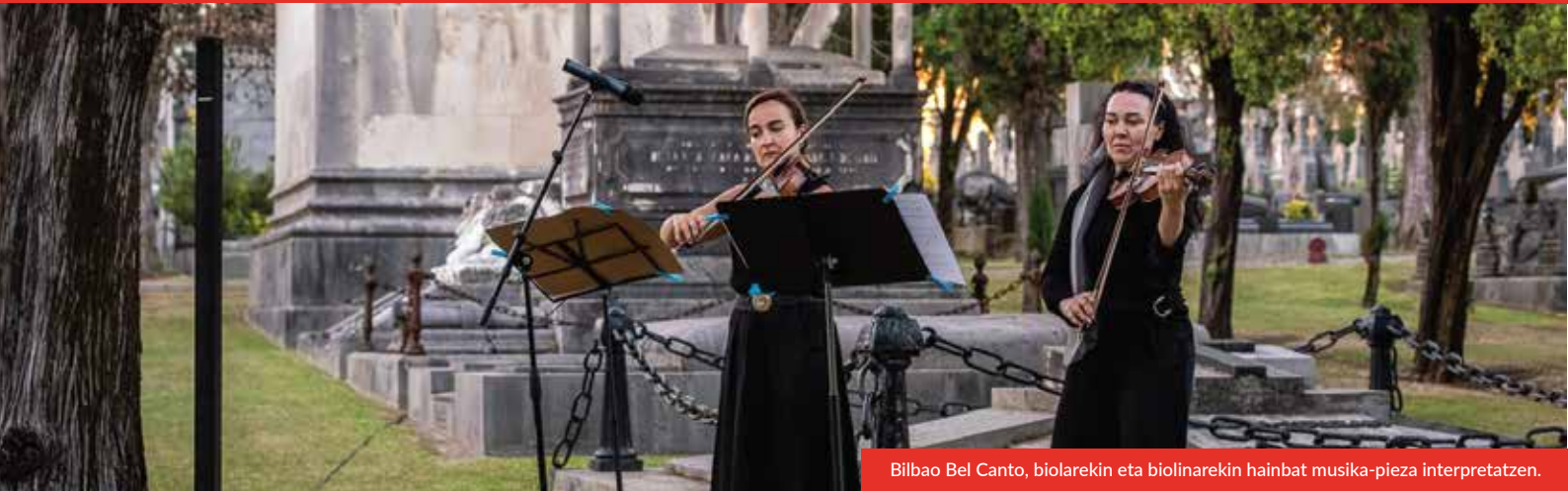
Bilbao Bel Canto, biolarekin eta biolinarekin hainbat musika-pieza interpretatzen.