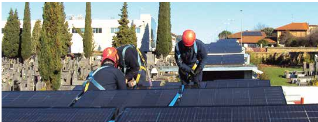
La actuación se ha llevado a cabo en la cubierta de diez edificios destinados a nichos y en el tejado a dos aguas del edificio de vestuarios del personal del propio Cementerio.

La «iniciativa urbana más grande del mundo en materia de clima y energía», agrupa a miles de autoridades locales y regionales con el compromiso voluntario de aplicar en sus territorios los objetivos climáticos y energéticos de la UE. Bilbao, como firmante promete reducir las emisiones de CO 2 en al menos un 40 % de aquí a 2030 y adoptar un enfoque integral para abordar la atenuación del cambio climático y la adaptación a este.