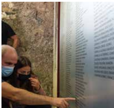
Espainiako Gerra Zibilean fusilatutako 538 pertsonen omenezko plaka