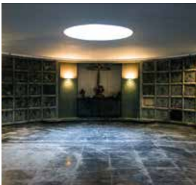
Bilboko hilerriko kriptak

Ikuspegi historiko batetik, Bilboko Udal Hilerriak XX. mendean, 1902ko apirilaren 27an inauguratu zenetik, Bilboko historia astindu duten gertaera mingarri guztien lekukotza jasotzen du.